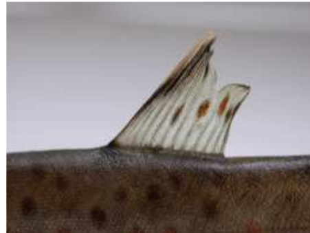
14 pav. Šlakių mailiukų, išleistų 2008 m. birželio mėn. į Plaštakos upę ir sugautų jauniklių (0+) rugsėjo mėn. nugariniai pelekai dalinai atsistatę