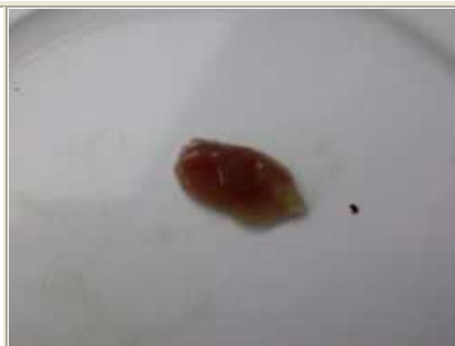
6 pav. Šlakių mailiaus, augusių veislyne, kepenys - rausvai rudos spalvos, standžios, lygiais kraštais (23,5%)