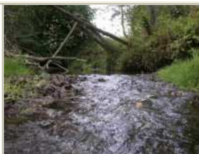
2 pav. Šašuolos upė