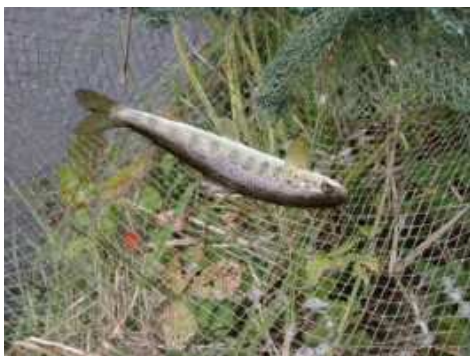
15 pav. Natūralaus neršto (Šašuolos upė) šlakių jauniklių (0+) sveiki pelekai

2008 06 Veislynas (n = 85) – uodeginio peleko nekrozė konstatuota 58 individams (68,2%); iš jų 54 individams (93,1%) kartu buvo stebima ir krūtininių bei nugarinių pelekų nekrozė. Krūtinės, nugaros ir pilvo pelekai, dėl anksčiau buvusio uždegimo ir nekrozės būna depigmentuoti, sunykę ir deformuoti, galai sustorėję, gleivėti, sutrumpėję iki 30–50 proc. buvusio ilgio (Pav. 11). 27 individams (31,8%) visi pelekai buvo sveiki.