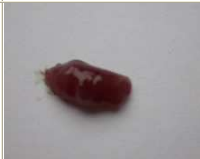
8 pav. Šlakių jaunikių (0+), augusių veislyne, kepenys - rausvai rudos spalvos, standžios, lygiais kraštais (47,1%)