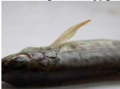
13 pav. Šlakių mailiukų, išleistų 2008 m. birželio mėn. į Plaštakos upę ir sugautų jauniklių (0+) rugsėjo mėn. krūtininiai pelekai dalinai atsistatę