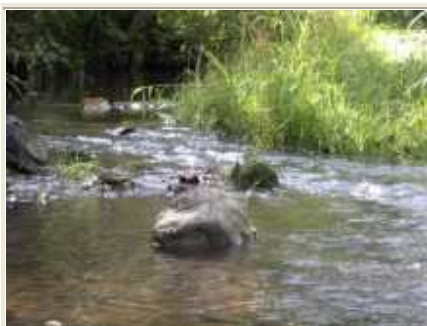
1 pav. Plaštakos upė