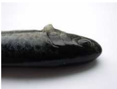
11 pav. Šlakių mailiukų, augusių veislyne krūtininiai pelekai depigmentuoti, sunykę ir deformuoti, galai sustorėję, gleivėti.

Skirtingomis sąlygomis augusių šlakių mailiaus ir jauniklių pelekų būklė parodyta 11-15 paveiksluose.