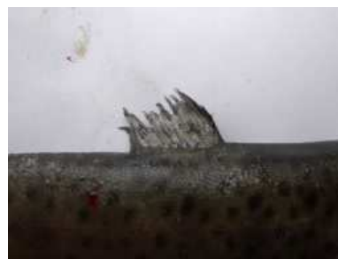
12 pav. Šlakių jauniklių (0+), augusių veislyne, nugarinių pelekų nekrozė