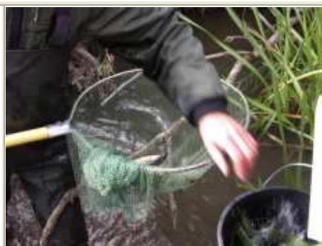
4 pav. Sugauti šlakių jaunikliai (0+)

Tyrimo metu Žeimenos lašių veislyne ūkio specialistų buvo pastoviai sekamas vandens hidrocheminis režimas: vandens temperatūra, ištirpusio deguonies koncentracija (prisotinimas %), pH, amonio koncentracija vandenyje (1 lentelė).