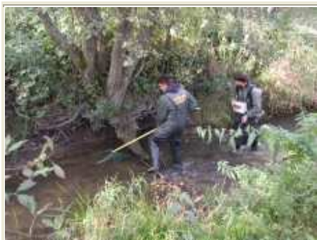
3 pav. Žuvų gaudymas elektros žūklės aparatu